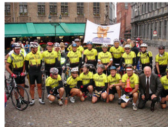
УЧАСТНИКИ ВЕЛОПРОБЕГА БРЮГГЕ - МОСКВА ПОСЕТИЛИ БЕЛАРУСЬ.